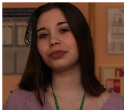
Ответственный редактор Виктория Гусева

Вот мы и дождалась первый выпуск фестивальной газеты. Фестиваль только начался, но у участников уже много впечатлений и заряд энергии неиссякаем. Позади уже два экономических года, первый этап «Мисс и мистер фестиваля», «Тропа доверия», и многое другое. Впереди нас ждёт еще много чего интересного, а чтобы быть в курсе событий фестиваля, вам поможем мы. Дорогие навигаторы, я желаю вам оставаться такими же заряженными, не сдаваться, идти до конца и стремиться к победе. Мы верим, у вас всё получится!!!